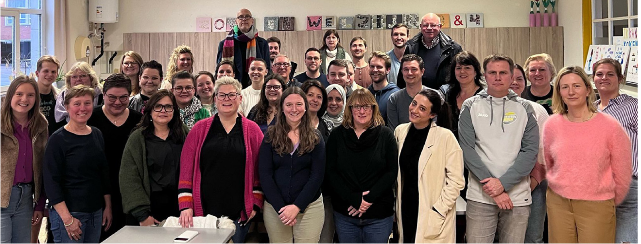
Ons toegewijd team van leerkrachten