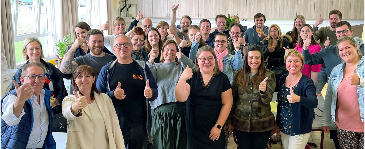
Ons toegewijd team van leerkrachten